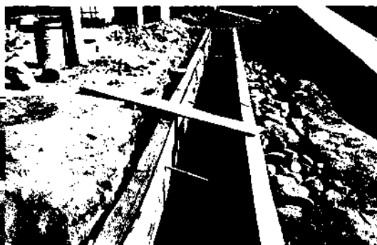
Fotografía 2 Construcción área cambio de aceite