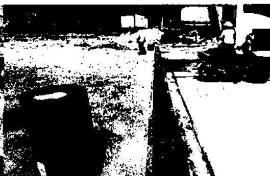
Fotografía 4 Rejilla perimetral

En ese orden de ideas, el Área Metropolitana de Bucaramanga, dará lugar a las acciones administrativas sancionatorias por realizar aprovechamiento de los recursos naturales sin contar con los respectivos permisos.