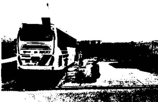
Fotografía 1 Zona de lavado

A continuación se anexa registro digital fotográfico: