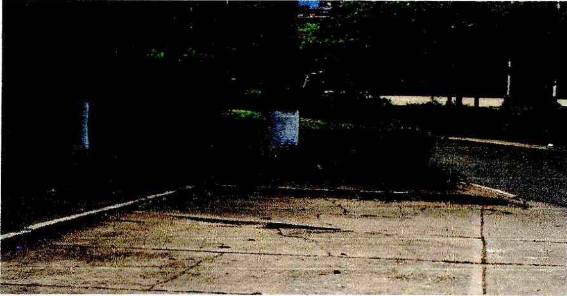
Imagen 1: Evidencia de visita técnica al sitio señalado.

Evidencia y registro fotográfico de la visita técnica.