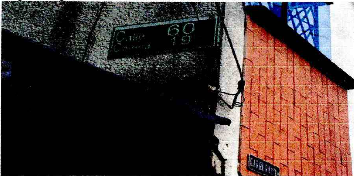
Imagen 2: Registros de la dirección de la Visita Técnica.