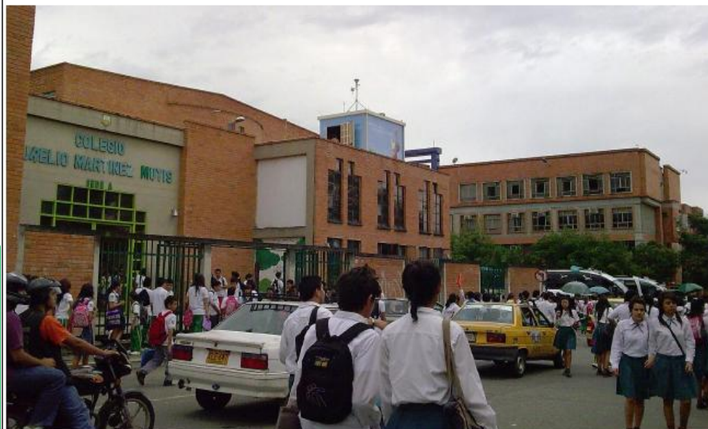
Calle de los Estudiantes Real de Minas, Terraza Colegio Aurelio Martínez Mutis