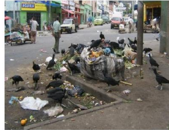
Figura 28. Disposición de basuras al culminar las labores en la Plaza de Mercado de San Francisco.