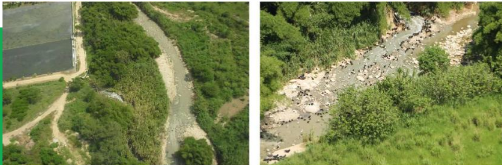
Figura 29. Panorámica de la Planta de Tratamiento de Aguas Residuales Rio Frio. Abajo se muestra el descargue de agua tratada (izquierda) y el vertimiento (derecha).